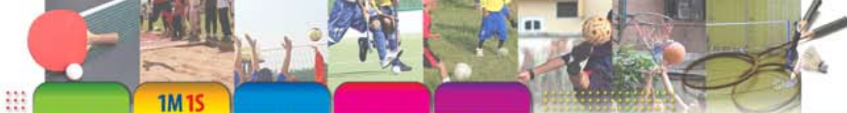
Jadual 6 : Cadangan Kaedah Pelaksanaan Dasar 1M 1S